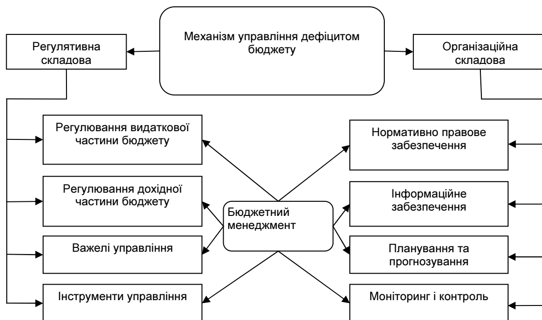
Рис. 2. Складові механізму управління бюджетним дефіцитом

Основними компонентами механізму управління дефіцитом бюджету є організаційна та регулятивна складові, представлені на рисунку 2. Організаційна складова включає нормативно-правове забезпечення, планування та прогнозування, інформаційне забезпечення, моніторинг та контроль. Регулювання бюджетного дефіциту відбувається шляхом регулювання доходної та видаткової частини бюджету за рахунок використання фінансових важелів та інструментів.