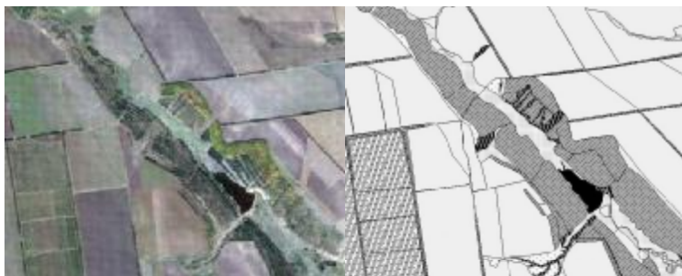
Рис.1. Приклад формування меж обстежуваних ділянок сільськогосподарських підприємств за космічним зображенням

просторі та дозволяє за необхідності здійснювати навігацію на будь-яку вказану точку за будь-якої заданої траєкторії.