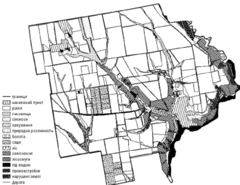
Рис.3. Фрагмент ґрунтової цифрової карти сільськогосподарських підприємств

Далі створюється електронна геоморфологічна карта на основі цифрування топографічної основи з отриманням тривимірної цифрової карти рельєфу або автоматично із застосуванням векторизаторів, що оцифровують відскановану з кальки сітку контурів. Топографічна векторна карта СТОВ «Авіатор» Вознесенського району була отримана в процесі автоматичної векторизації ізоліній рельєфу топографічної карти у програмі Easy Trace.