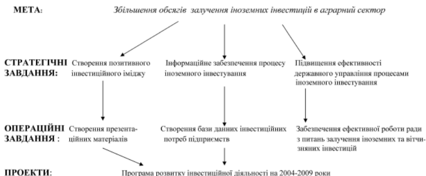
Рис.3. Стратегія розвитку інвестиційної діяльності Миколаївської області

Для удосконалення організації залучення іноземних інвестицій в аграрний сектор, доцільним буде розробити відповідну стратегію ( рис. 3.).