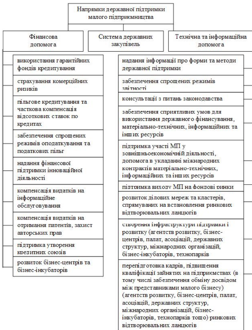
Рис.2. Основні напрямки державної підтримки малого підприємництва у країнах світу.