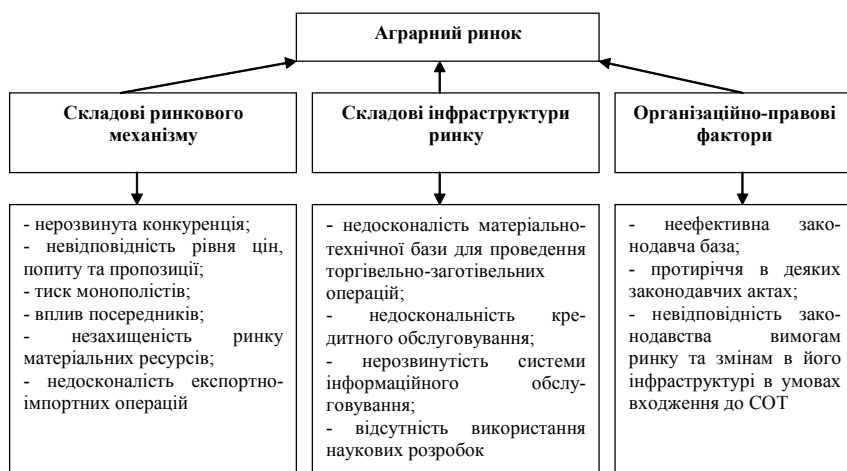
Рис.1. Фактори негативного впливу на формування аграрного ринку

Спробуємо згрупувати фактори негативної дії та виявити основні напрямки мінімізації їх впливу на діяльність сільськогосподарського підприємства (рис.1.).