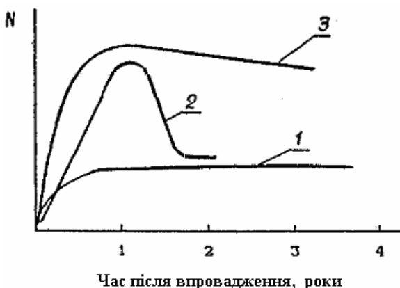
Рис.1. Залежність відмов від рівня управління якістю: N – число відмов на рік; 1 – крива відмов в умовах управління якістю; 2 – крива відмов в умовах системи контролю якості; 3 – крива відмов в умовах відсутності системи управління якістю.

Роль контролю в забезпеченні якості продукції за останні роки зазнала істотних змін. Він розглядається не як самостійний вид діяльності по забезпеченню якості, а як складова системи управління якістю. Система управління якістю виробництва виробів у порівнянні з контролем дозволяє значною мірою скоротити відмовлення техніки з перших днів експлуатації в декілька разів (рис.1).