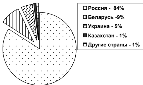
Рис.1. Удельный вес экспорта молдавских вин в 2003 году в страны СНГ

Географическая карта экспорта является разнообразной, но главными импортерами молдавской винодельческой продукции являются страны СНГ, на рынках сбыта которых реализуются 95,6% всей экспортированной продукции. Удельный вес экспорта молдавских вин в страны СНГ согласно данным 2003 года представлен на рис. 1.