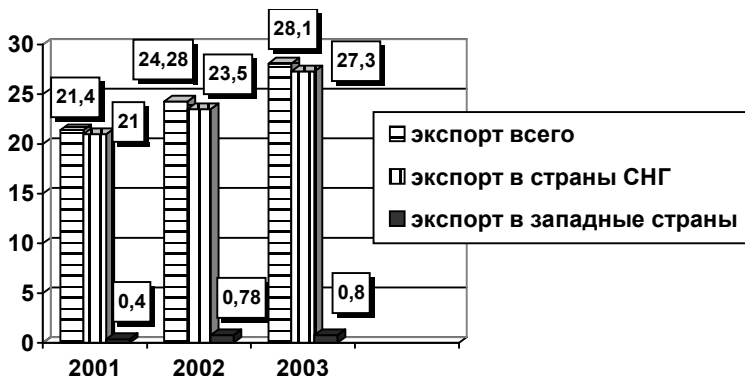
Рис.3. Экспорт молдавских вин за период 2001-2003

Место молдавских вин на рынках западных стран в период 2001-2003 гг. отражено на рис.3