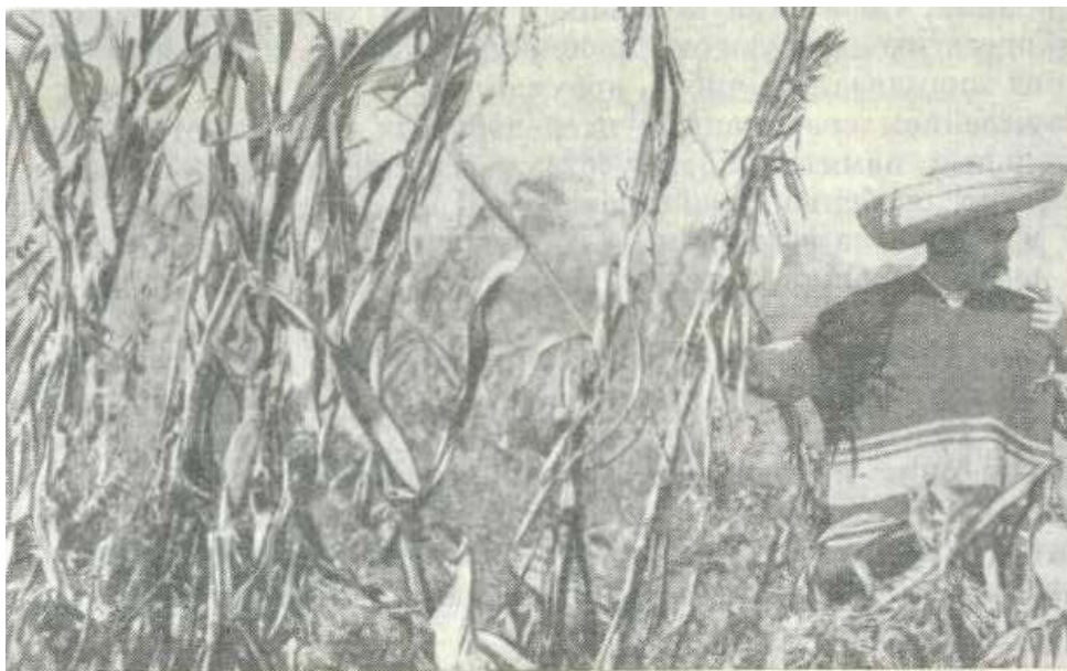
Фото 1. Поле кукурудзи поблизу Мексики, засмічене теосінте, 1930 р. (за М. І. Вавиловим [1])

Сучасна біологічна наука вже не ставить під сумнів важливість і цінність генетичного потенціалу диких споріднених видів для створення нових перспективних форм сільськогосподарських рослин і тварин. Це пов'язано, перш за все, зі значними теоретичними здобутками й новими технологіями втілення цих теоретичних надбань у практичній селекції. Стосовно селекції рослин, наука постійно відкриває все нові корисні ознаки і властивості у видів, які раніше вважалися не потрібними і навіть шкідливими [11]. У Мексиці та Гватемалі, наприклад, донедавна відчутних втрат виробникам зерна кукурудзи завдавало теосінте ( Euchlaena mexicana Schrad. ), котре, засмічуючи плантації (фото 1), пригнічувало рослини кукурудзи, що значно зменшувало урожай. Крім того, кукурудза схрещувалась із теосінте і вироджувалася [2, 10].