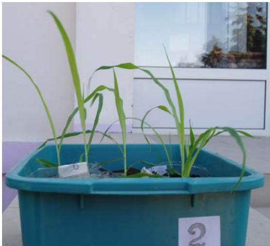
Фото 4. Розсада теосінте перед висадкою у відкритий ґрунт

Протягом 1999-2010 років робота з цими зразками в нашій установі проводилася з метою розмноження насіння та закладки на середньострокове зберігання в сховищі станції, а також для забезпечення насінням й інформацією про нього наукових та освітніх закладів, інших споживачів. Періодично зразки пересівалися для поновлення життєздатності насіння. В процесі роботи нами вдосконалено методику, розроблену Г.Є. Шмараєвим та Л.С. Мельник [19], з вирощування цієї рослини в умовах штучно створеного короткого дня. Необхідність внесення певних змін до методики була викликана появою нових, сучасних полімерних матеріалів, а також змінами погодних умов у літньо-осінній період, порівняно з 70-80 роками минулого століття. Розсаду кожного зразка теосінте у відкритий ґрунт висаджували на окремій ізольованій ділянці, де крім догляду проводили також фенологічні спостереження (фото 4, 5).