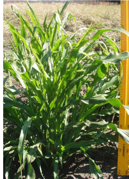
Фото 5. Ізольована ділянка теосінте

роботу Устимівська дослідна станція, з великими труднощами розмножували теосінте популяції Чалко, нам якраз цей зразок вдалося розмножити найуспішніше. Це ще одне свідчення про зміни умов росту і розвитку рослин, що сталися за останні 35-40 років.