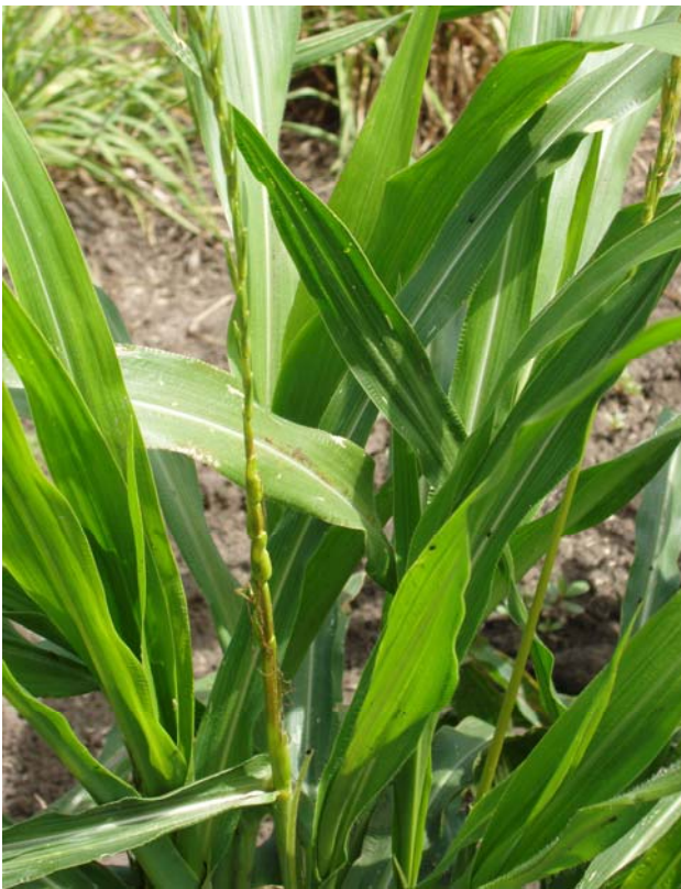
Фото 2. Зовнішній вигляд рослин теосінте популяції Чалко, 2010 р.

Теосінте – найближча до кукурудзи дикоросла рослина, що має таке ж гаплоїдне число хромосом ( n=10 ), легко схрещується з нею в природі та в штучних умовах, тому широко використовується для гібридизації з кукурудзою [20] (фото 2).