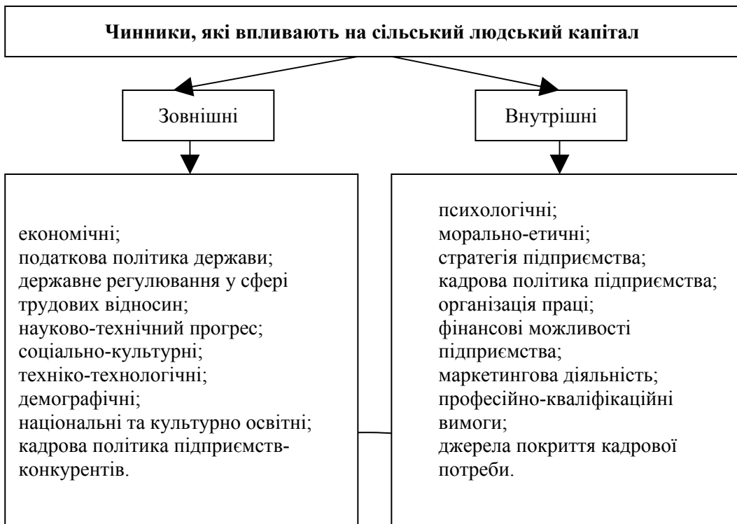
Рис.1. Чинники формування людського капіталу на селі.

Із рис. 2 видно, що розвиток людського капіталу можливий лише у разі зрівноваженого розвитку всіх структурних елементів системи, оскільки лише за таких умов забезпечується достатній рівень відтворення, розвитку та реалізації функцій людського капіталу, що є запорукою досягнення мети аграрної політики. Заходи щодо розвитку людського капіталу дозволяють досягти першочергової мети – підвищення рівня життєдіяльності сільського населення та ефективності сільськогосподарського виробництва.