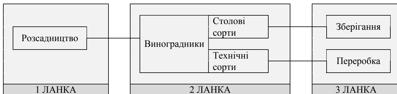
Рис. 1. Схема комплексу технологічних ланок галузі виноградарства

Українське виноградне розсадництво в промислових масштабах практично не функціонує. На сьогодні в Україні збереглося до 10 суб'єктів господарювання, які займаються вирощуванням садивного матеріалу винограду. Станом на 2015 рік в суб'єктах господарювання, що займаються виробництвом садивного матеріалу багаторічних культур, вирощено саджанців столових сортів у кількості 202,7 тис.шт., 30 найменувань; технічних – 630,0 тис. шт., 19 найменувань; універсальних – 0,2 тис. шт., 2 найменувань [1]. Виробнича потужність цих господарств дозволяє забезпечити потреби лише дрібних товаровиробників.