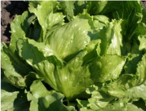
Рис. 3. Салат головчастий типу Маравіла.

Салат - ромен . Сорти цієї різновидності формують головку або напівголовку з видовженими твердими листками та чітко вираженою центральною жилкою. Переважаюча форма в поперечному перерізі еліптична, висота головки переважно понад 1,5 її діаметра (рис. 4). У 2009 р. до Реєстру сортів занесено сорт салату – ромен Монах.