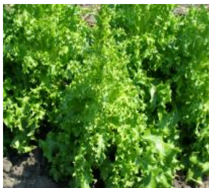
Рис. 8. Тип салату листового Catalogna.