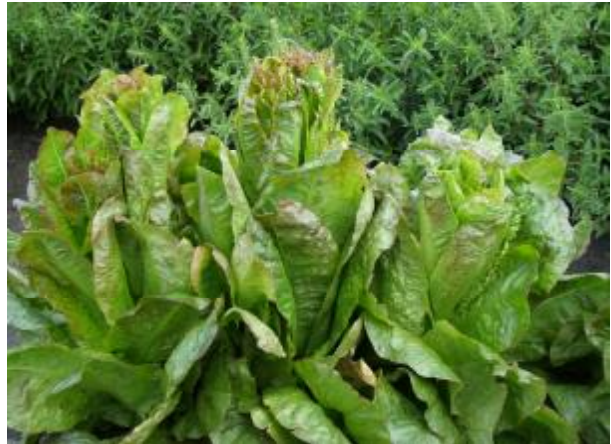
Рис. 4. Салат – ромен (римський).

Зрізний салат (салат прискореного зрізу), листковий . Достатньо гете-