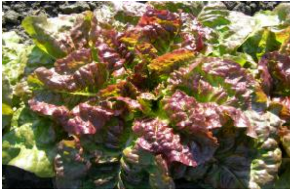
Рис. 5. Салат латинський або грас-салат.

До Реєстру сортів 2008 р. занесено сорти салату листового Малахіт, 2009 р. – Дослідник.