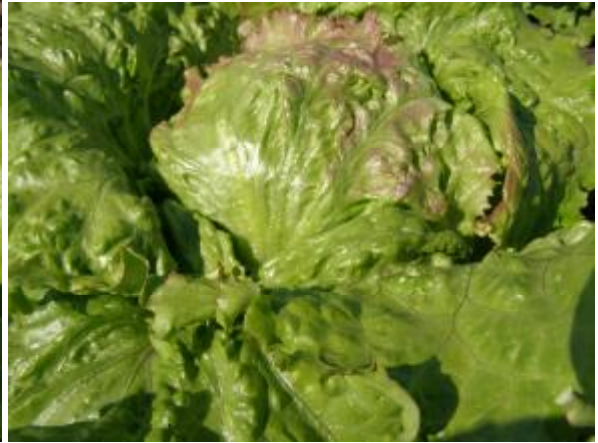
Рис. 2. Салат головчастий хрумкого типу (Айсберг).

Маравіла має товсті тверді листки зі слабкою або відсутньою пухирчастістю (рис. 3). Більшість сортів останнього типу відноситься до пізньостиглих, часто вони не утворюють стебла і насіння (в північних умовах України). Тому в насінництві такі сорти вирощують розсадним способом або надрізають верхівки головок для прискорення стеблоутворення.