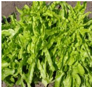
Рис. 7. Салат листовий типу Oakleaf (дуболистковий).

До Реєстру сортів 2009 р. занесено сорт салату листового дуболисткового типу Галичанка (рис. 8), а 2003 р. – сорт салату листового Зорепад (рис. 9).