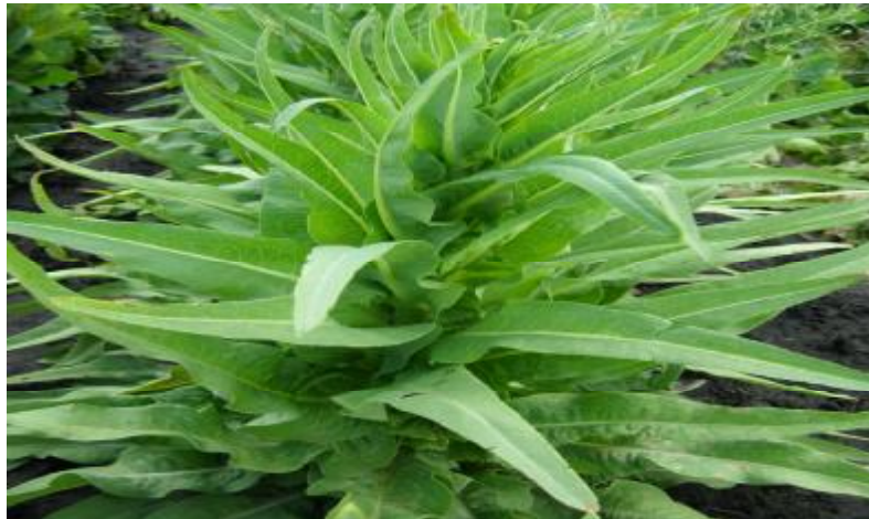
Рис. 10. Салат стебловий (уйсун).