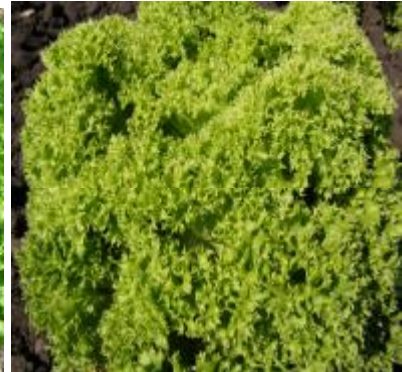
Рис. 9. Салат листовий з хвилястим краєм листової пластинки.

Тобто, до п'ятої різновидності тепер віднесені всі сорти, що не формують головок і до введення цих змін називалися просто «листові» або «латук».