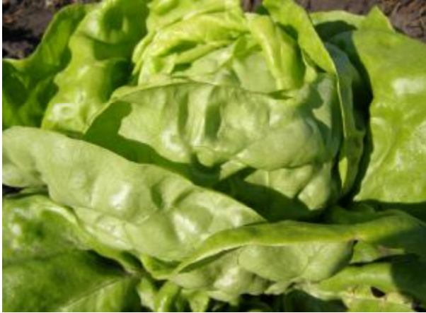
Рис. 1. Салат головчастий маслянистого типу.

Маравіла має товсті тверді листки зі слабкою або відсутньою пухирчастістю (рис. 3). Більшість сортів останнього типу відноситься до пізньостиглих, часто вони не утворюють стебла і насіння (в північних умовах України). Тому в насінництві такі сорти вирощують розсадним способом або надрізають верхівки головок для прискорення стеблоутворення.