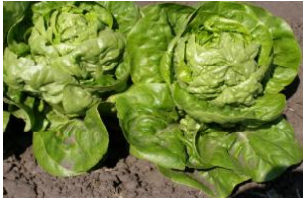
Рис. 6. Салат листовий.

Морфологічним описом доведено, що листові салати дуже відрізняються ступенем розчленування листової пластинки.