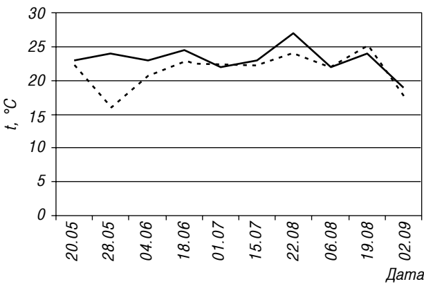
Рис. 1. Коливання температури води у вирощувальних ставках протягом вегетаційних сезонів 2007–2008 рр.: — 2007 р.; ---- 2008 р.

Слід відзначити, що протягом періодів вирощування риби спостерігалось заростання ставків як м'якою підводною (у деяких ставках до 40–80%), так і жорсткою надводною рослинністю (до 5–20%). Переважно це були кушир занурений, грічак земноводний, водопериця колодова, рдести, рогіз широколистяний, очерет звичайний тощо.