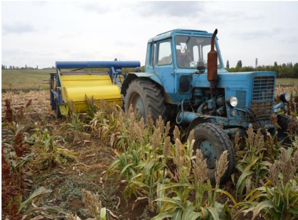
Рис. 1. Полевые испытания устройства для очеса зернового сорго на корню.

В соответствии с планом эксперимента было реализовано восемнадцать вариантов сочетания четырех факторов в конструкции экспериментальной установки (рис. 1) и получены результаты (табл. 1).