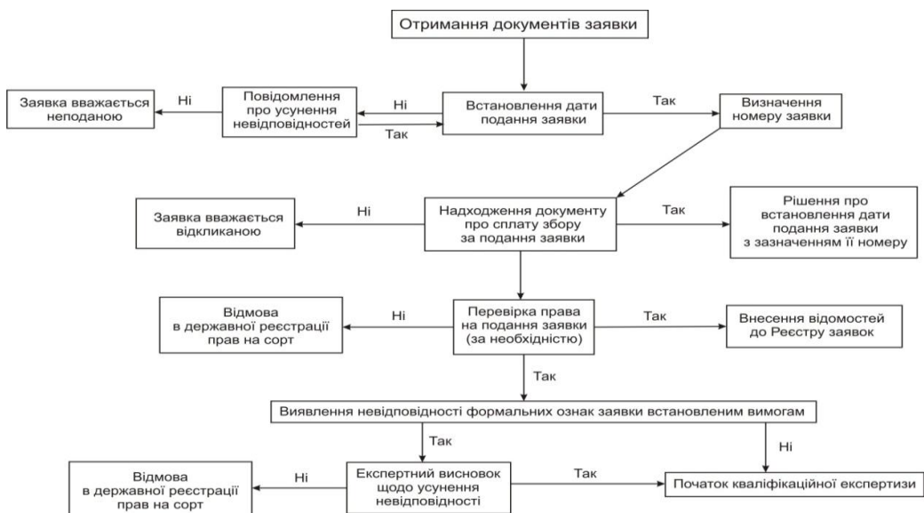
Рис. 1. Складання та подання заявки

Заявка до Уповноваженого органу подається особою, що має на це право (Заявник). В першу чергу це право належить автору (авторам – якщо їх декілька) сорту. Автор сорту (селекціонер) – людина яка безпосередньо вивела або поліпшила сорт [1].