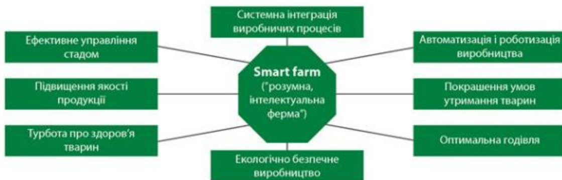
Рис. 7. Інноваційна концепція Smart Farm

Концепція Smart Farm в Україні вважається перспективною для розвитку тваринництва, оскільки вона сприяє полегшенню роботи фермерів, враховує потреби та фізіологію тварин, покращує контроль та управління виробництвом, що в результаті призводить до отримання високоякісної продукції. З метою успішної імплементації цієї концепції необхідним є залучення підтримки від держави для створення нових сільськогосподарських господарств з використанням інноваційних технологій, реконструкція існуючих споруд, проведення селекційної роботи для створення високопродуктивних порід, підготовка кваліфікованих спеціалістів для роботи з інноваційними системами та проведення наукових досліджень з метою виявлення нових інноваційних рішень.