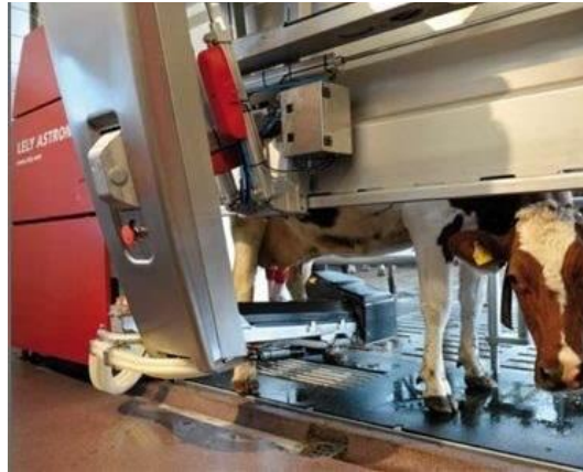
Рис. 5. Роботизована рука для доїння

Ефективність годівлі тварин значною мірою залежить від вирішення проблеми розподілу кормів. Від 25 до 35% всіх витрат праці на виробництво молока або м'яса витрачається на цей процес. Таким чином, вдосконалення технології годівлі визначено як одне з ключових завдань для сільськогосподарських підприємств.