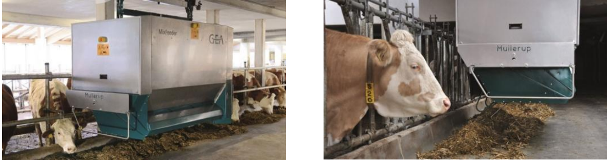
Рис 3. Автоматизована система годування Mix Feed

Автоматизовані системи доїння вважаються одним із найбільш значущих технологічних досягнень у молочній промисловості через їхню здатність знижувати негативний вплив людського фактора, такого як помилки під час доїння та мікробіологічне забруднення, на якість отриманого молока. Перші системи автоматизованого доїння виникли в Нідерландах у 1992 році. Поступово автоматизовані системи доїння стали загальноприйнятною технологією та стандартною практикою в галузі доїння.