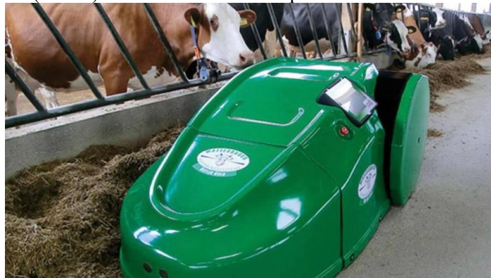
Рис. 6. Робот підгортач Butler Gold

Одним із найефективніших рішень для цієї технологічної задачі є використання австрійського робота підгортача Butler Gold (Рис. 6) з запатентованим спіральним шнеком.