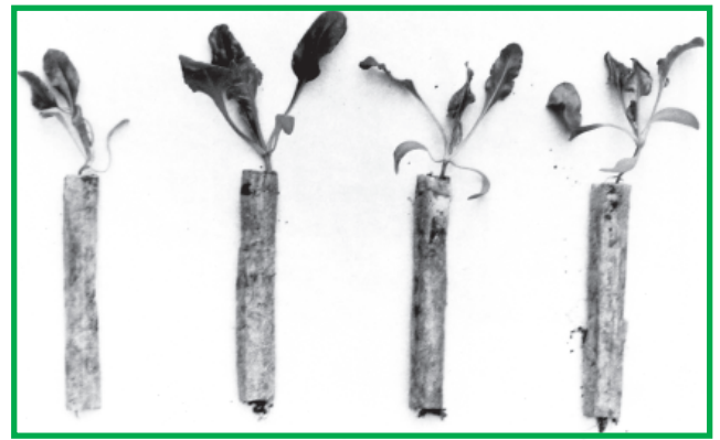
Рис.1. Паперові стаканчики (paper-pot) з рослинами цукрових буряків

Висновки. Розсадний спосіб вирощування цукрових буряків сприяє збільшенню вегетаційного періоду на 35...40 днів та суттєвому підвищенню врожайності коренеплодів і збору цукру з одиниці площі. При цьому зменшується шкодочинність шкідників та хвороб, таких як коренеїд, гнилі, нема-