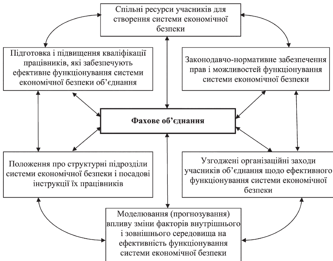
Рис. 1. Система економічної безпеки фахового об'єднання

забезпечення захисту інформаційного поля, комерційної таємниці і досягнення необхідного рівня інформаційного забезпечення роботи всіх підрозділів підприємства та відділів організації;