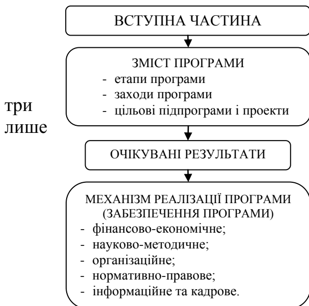
Рис. 3. Оптимальна структура державної цільової програми

До проблем змісту відносяться: відсутність уніфікованої структури побудови; тільки половина програм надають інформацію щодо фінансування, чверті мають очікувані результати, і п'ята частина чітко вказує замовника; переважна більшість програм не мають посилання на стратегічні документи; багато програм є занадто об'ємними.