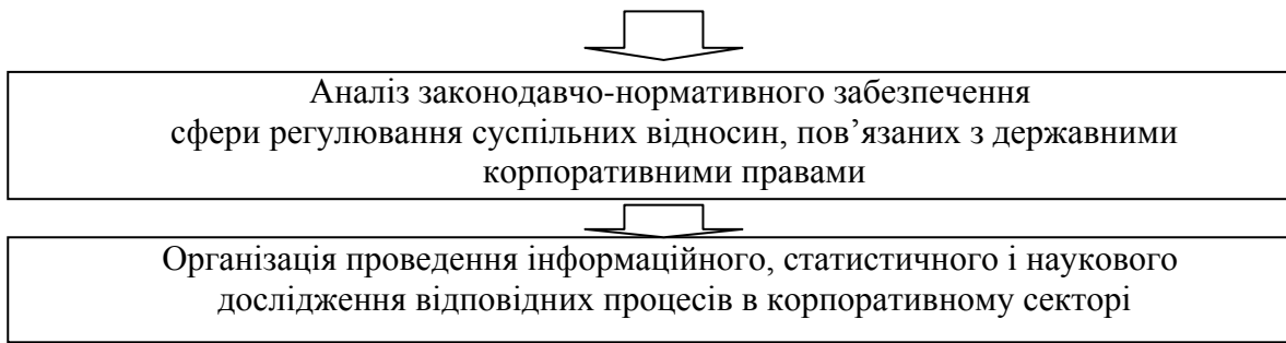
Рис.2. Організаційний механізм формування Концепції управління державними корпоративними правами

В дисертації інститут корпоративного управління розглядається як система правил і механізмів управління акціонерним товариством, норм поведінки, які структурують взаємні відносини суб'єктів корпоративного управління. Результати дослідження дозволяють зробити висновок, що в Україні для ефективного функціонування корпоративних відносин на різних економічних рівнях мають діяти різні моделі корпоративного управління (рис.3).