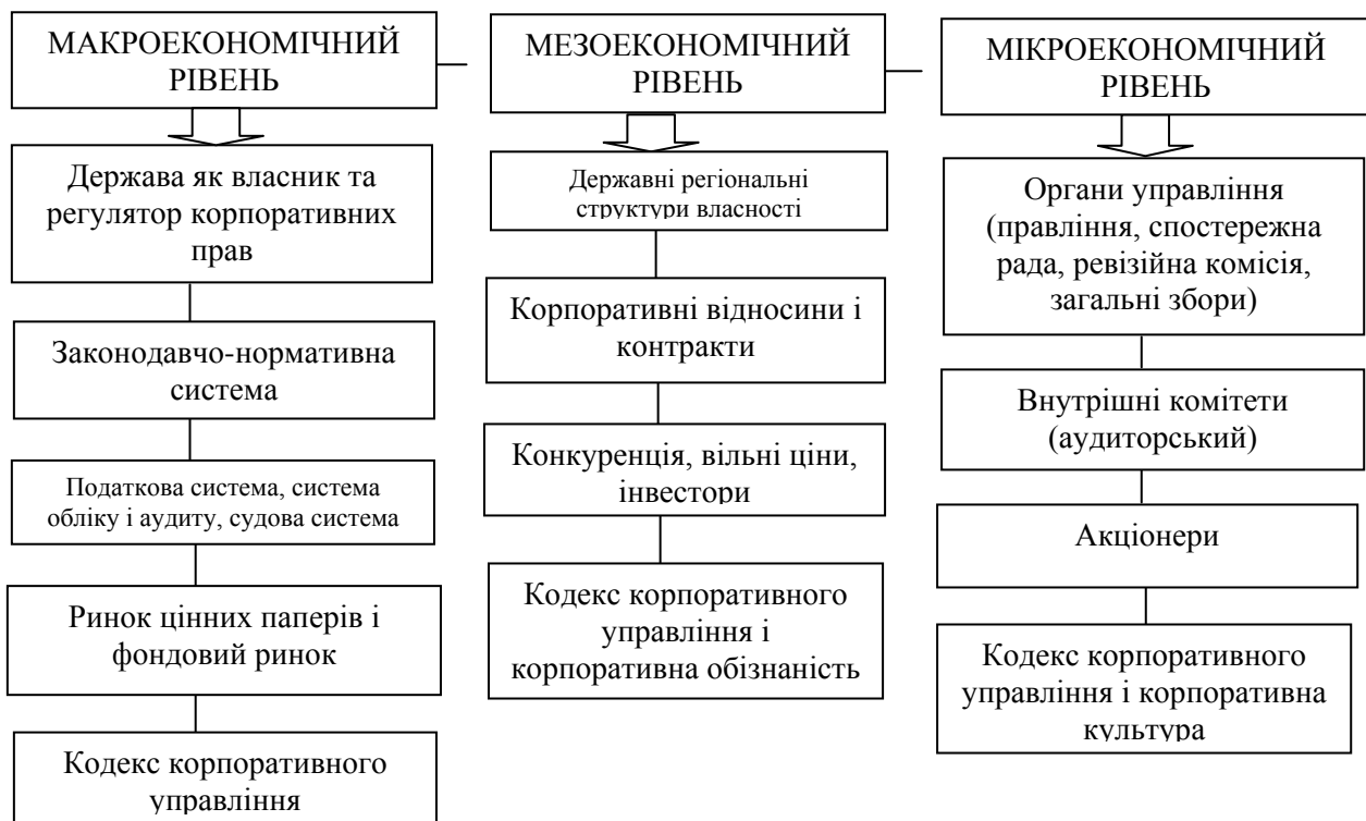
Рис. 3. Чинники, що впливають на функціонування української моделі корпоративного управління, за економічними рівнями

В дисертації інститут корпоративного управління розглядається як система правил і механізмів управління акціонерним товариством, норм поведінки, які структурують взаємні відносини суб'єктів корпоративного управління. Результати дослідження дозволяють зробити висновок, що в Україні для ефективного функціонування корпоративних відносин на різних економічних рівнях мають діяти різні моделі корпоративного управління (рис.3).