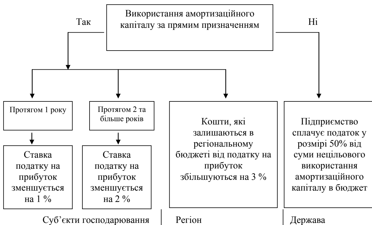
Рис. 3. Алгоритм стимулювання використання амортизаційного капіталу за прямим призначенням на основі інвестиційно-інноваційного важеля впливу

Із метою спонукання підприємства до використання амортизаційного капіталу на відтворення основних засобів запропоновано алгоритм стимулювання використання амортизаційного капіталу за прямим призначенням на основі інвестиційно-інноваційного важеля впливу (рис. 3.).