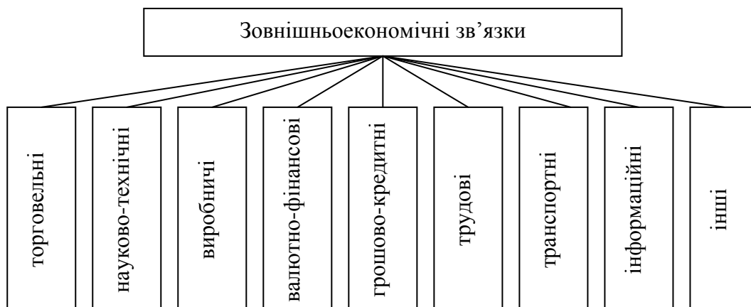
Рис. 1. Види зовнішньоекономічних зв’язків

В процесі вивчення літературних джерел з предмету дослідження з’ясовано, що найбільш широко розробленою класифікацією є система зовнішньоекономічних зв’язків, яка включає торговельні, інвестиційні, науково-технічні, кредитно-фінансові, туристичні зв’язки, а також зв’язки зі спеціалізації та кооперування, які більш доречно було б назвати виробничими (рис.1).