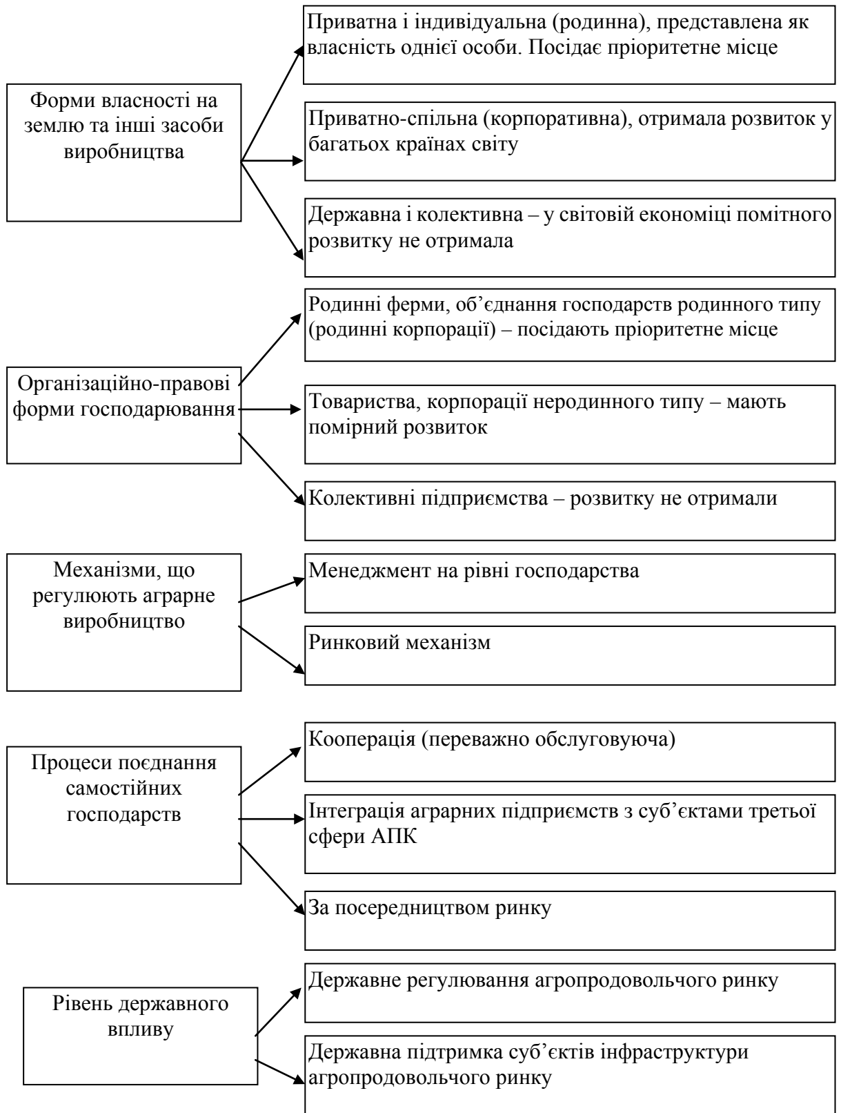
Рис. 2. Складові системи економічних відносин на агропродовольчому ринку

Економічна діяльність держави у сучасній системі аграрної економіки багатоаспектна і охоплює економічні, соціальні та правові сфери (рис. 3).