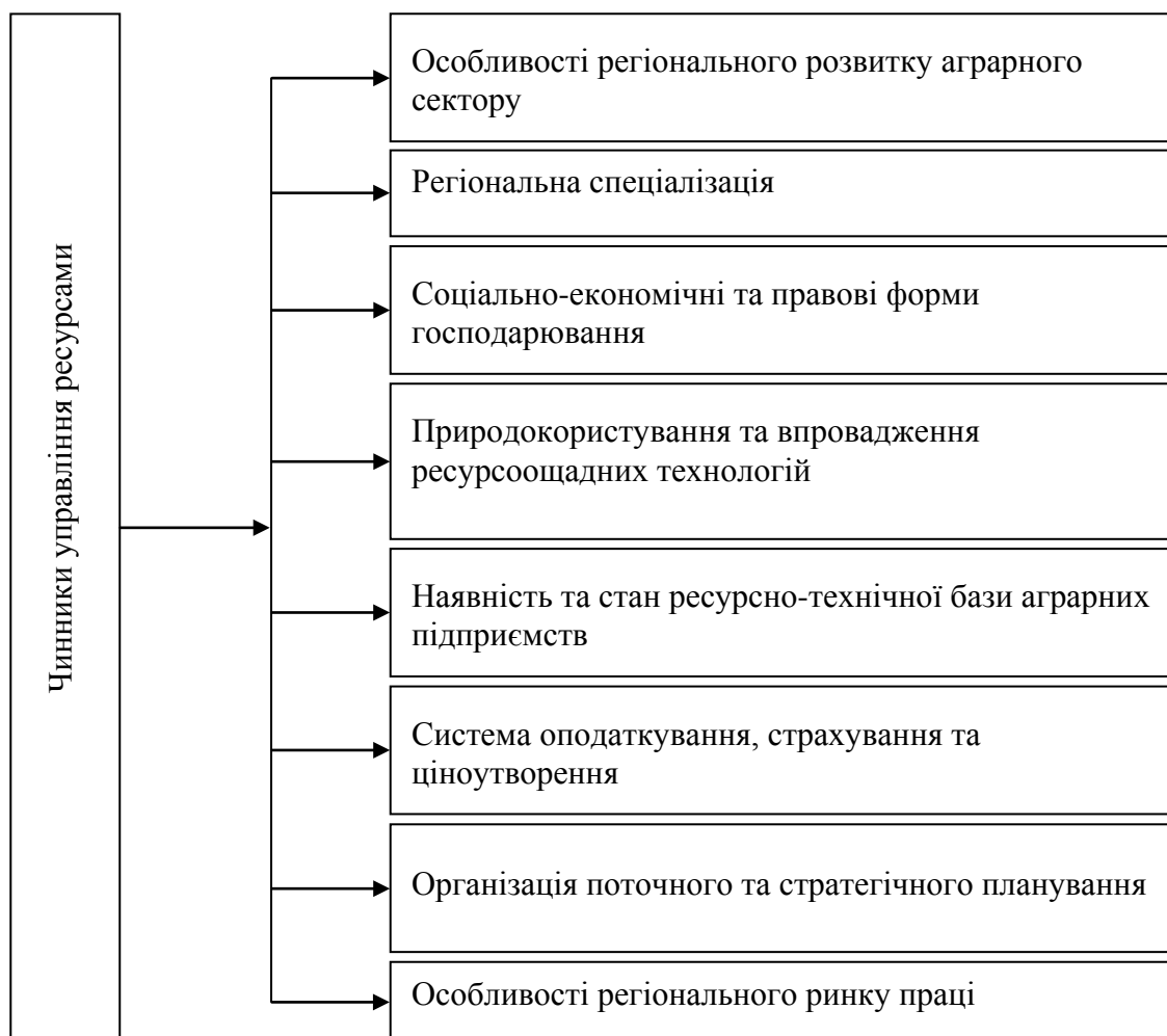
Рис. 2. Основні чинники державного та регіонального управління ресурсами аграрного сектору