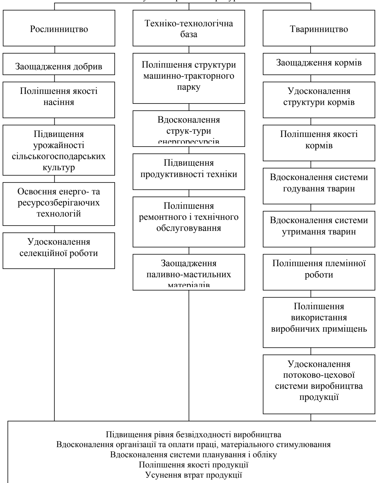
Рис. 1. Пропонована схема забезпечення ефективності ресурсовикористання в аграрному секторі

На основі дослідження виявлено, що актуальне на сучасному етапі економічного розвитку підвищення конкурентоздатності аграрної сфери потребує раціоналізації використання сукупності