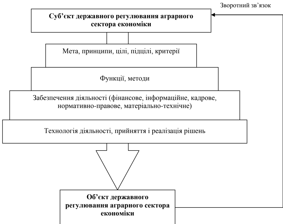
Рис. 1. Принципова схема формування впливу держави на аграрний сектор економіки як на об'єкт регулювання

Важливим методологічним аспектом державного регулювання розвитку аграрного сектора економіки є також урахування співвідношення між поставленою метою і досягнутим результатом. Неузгодженість мети та результату є фундаментальною характеристикою державного регулювання, що зумовлює його безперервний характер, оскільки кожний досягнутий результат неминуче ставить нові цілі, які потребують реалізації в умовах, що змінилися. Запропоновано основоположні принципи, на яких повинен ґрунтуватися механізм реалізації заходів державного регулювання економічних процесів в аграрній сфері (рис.1).