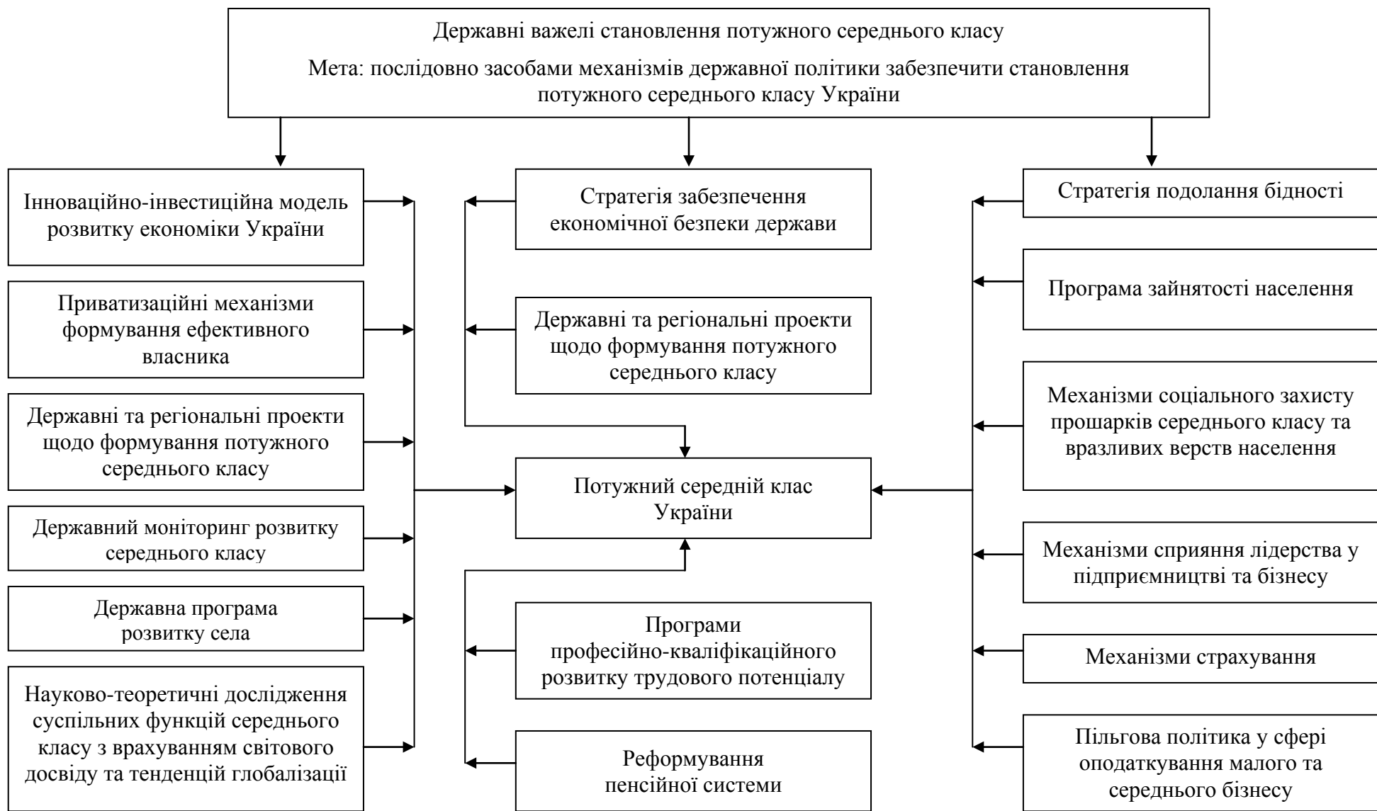
Рис. 2. Схема державних важелів становлення потужного середнього класу