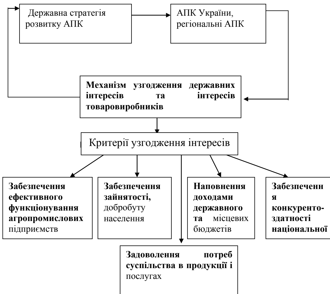
Рис. 1 Схема взаємоузгодження інтересів держави і підприємництва

етапі розвитку національної економіки повинна створити сприятливі умови як для суб'єктів підприємництва, так і для розвитку АПК в цілому. Це стосується відповідного нормативно-правового забезпечення, фінансово-кредитної політики, встановлення паритету цін, податкової системи, стимулювання матеріально-технічного забезпечення. Дисертантом запропоновано критерії узгодженості політики держави з інтересами товаровиробників в АПК (рис. 1).