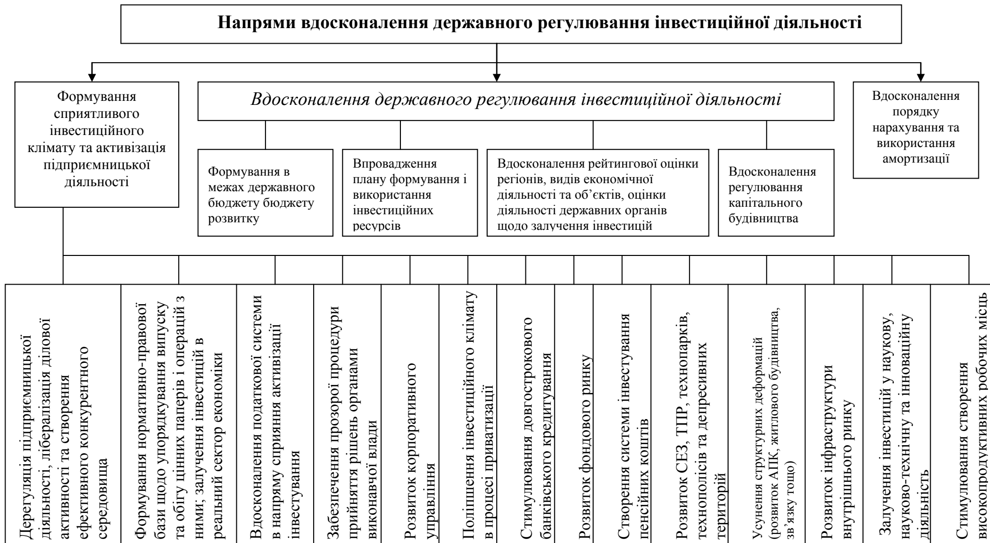
Рис. 2. Напрями вдосконалення державного регулювання інвестиційної діяльності