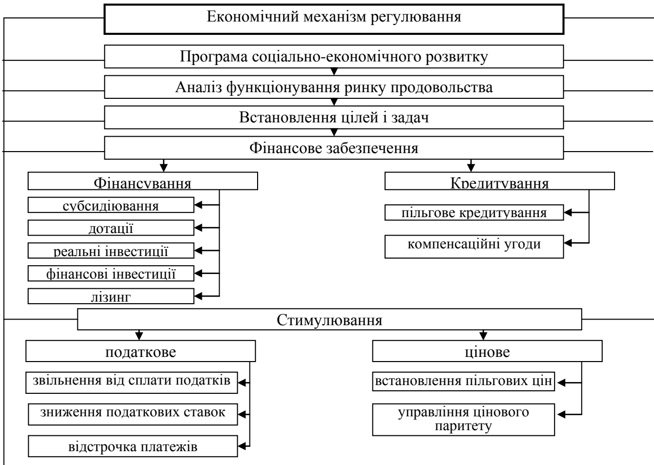
Рис. 3. Економічний механізм регулювання розвитку регіонального ринку продовольства

Продовольчий ринок є системою економічно-технічних зв'язків, які існують між продуктами харчування і його споживачами, (між продуктами харчування і підприємствами, які їх виробляють), де зберігається закон попиту і пропозиції і потребує державної підтримки в нормалізації обмінних відносин та стримуванні роздрібних цін. Необхідним є також регіональне регулювання розвитку ринку продовольства, створення фондів стимулювання його розвитку.