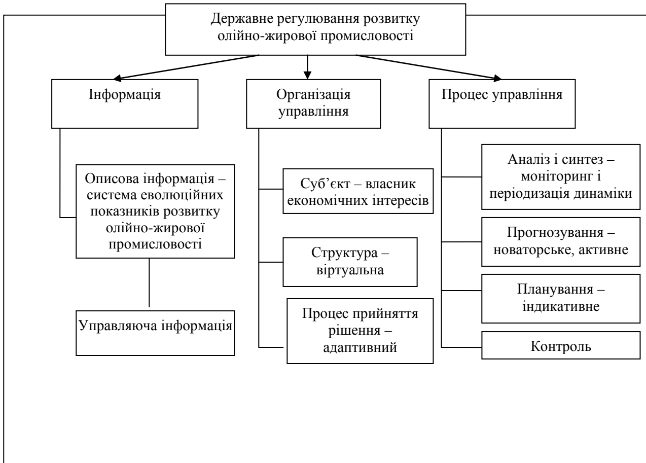
Рис.2. Державне регулювання розвитку олійно-жирової промисловості в системі еволюційної економіки

визначення ступеня взаємозв'язку інформації, організації та процесу управління (рис. 2).