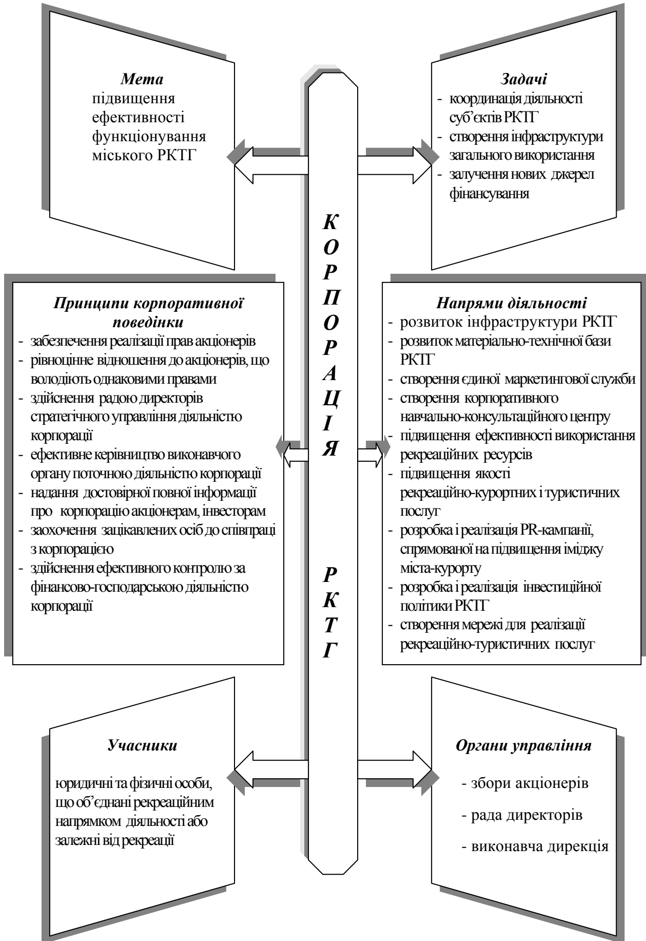
Рис. 2. Основні складові функціонування підприємницької корпорації міського РКТГ