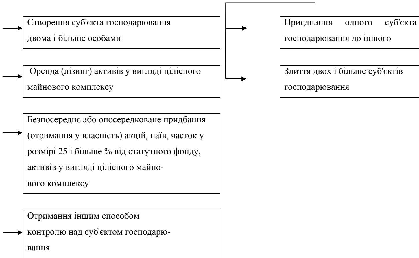
Рис. 1. Способи концентрації господарських структур в економіці

На базі проведеного теоретичного аналізу в дисертаційній роботі дано визначення терміну "економічна концентрація", а саме: дії незалежних суб'єктів господарювання, які призводять до зосередження виробництва, капіталу та/або ринкової влади під одним загальним контролем. При економічній концентрації на підставі стійких змін в структурі господарюючих суб'єктів на ринку створюється нова економічна одиниця.