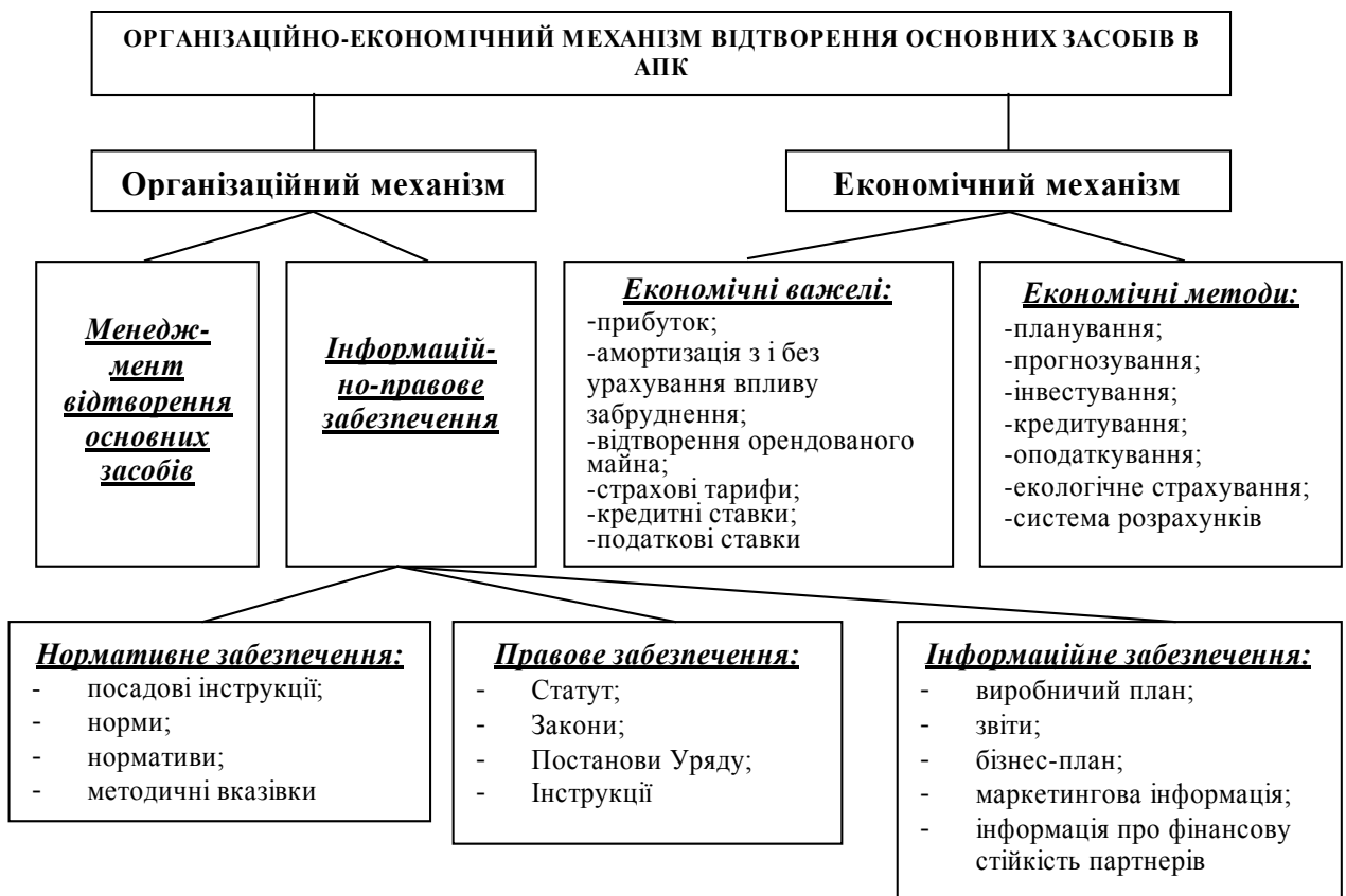
Рис. 2. Структура організаційно-економічного механізму відтворення основних засобів в АПК

Удосконалено організаційно-економічний механізм відтворення основних засобів шляхом введення нової стадії - "менеджмент відтворення". Така стадія складається з етапів: визначення виробничої потреби у відтворенні; оцінка ефективності відтворення основних засобів і її економічне обґрунтування; вивчення структури й аналіз фінансових джерел відтворення; розробка, оцінка альтернативних варіантів відтворення та вибір оптимального. Крім того, у зв'язку з незадовільним екологічним станом, ми пропонуємо виділити в економічному механізмі відтворення екологічне страхування та амортизацію з урахуванням впливу забруднення на прискорений знос основних засобів, а також відтворення орендованого майна (рис. 2).