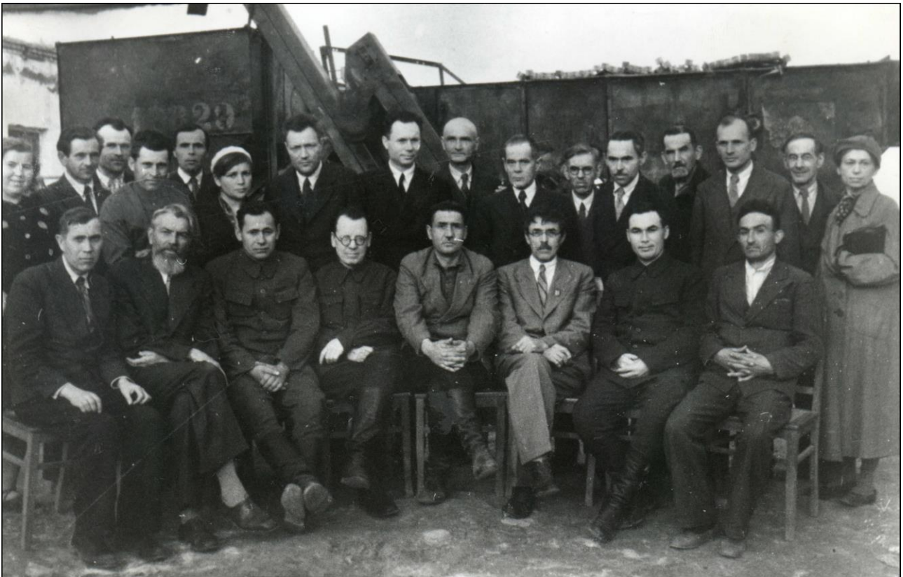
Рис. 2. Колектив ХСГІ в евакуації, м. Катта-Курган (Узбекистан), 1944 р.

У вересні 1943 р. розпочалася часткова реєвакація ЗВО з Узбекистану до України. Реєвакацію здійснювали в надскладних умовах воєнного часу. Цікаво, що новий 1943/44 навчальний рік інститут розпочав водночас у Харкові та Катта-Кургані, де заклад продовжував працювати як евакуйований (рис. 2).