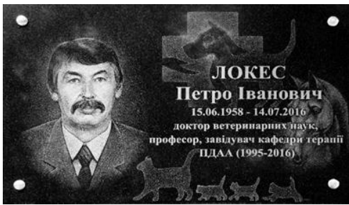
Мал. 4. Меморіальна дошка, встановлена на фасаді корпусу кафедри терапії ветеринарного факультету ПДАА

університету ветеринарної медицини та біотехнологій С.З. Гжицького: «Петро Іванович був надзвичайно скромною людиною. Virізнявся з-поміж інших як постать абсолютно індивідуальна, оригінальна і неповторна... Родина, друзі, робота – це для нього було святе... Таким він залишиться у нашій пам'яті... Буде вічно жити у добрих спогадах серед колег» [10].