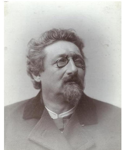
Рис. 7. Карл Немец (1839–1901) старший брат Я. Немеца

Вінницький період (1890–1898) у житті Ярослава Йосиповича пов'язаний не тільки з його адміністративною та освітянською роботою, але із активним захопленням садівництвом, як наукою. В цей період він заклав дослідний сад у маєтку своєї дружини та показовий садок на землях реального училища. Там же влаштував метеорологічну станцію. Помологія його цікавила не випадково, адже його старший брат Карл Немец (1839–1901) у той час вже був визнаним чеським експертом у садівництві (рис. 7.). Здобувши базову освіту садівника у рідній Чехії, Карла запросили на практичне стажування до австрійських приватних садів. Повернувшись на Батьківщину, він працював викладачем основ овочівництва, ботаніки та каліграфії в Королівській Провінційній Чеській академії у м. Табор. Значна популярність серед викладачів та студентів дозволила Карлу Немецу у 1896 р. стати директором філії австрійського помологічного інституту у Трої, поблизу Праги, яку він очолював аж до своєї смерті.