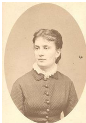
Рис. 2. Божена Немцова (Božena Němcová) (1820-1862) чеська письменниця, авторка оповідання «Бабуся» (1855) та циклу «Золота книга казок»