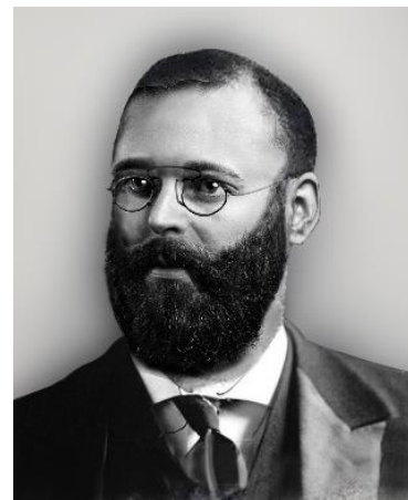
Рис. 1. Ярослав (Павло) Йосипович Немец 1898 р.

Цього року виповнюється 120 років з дня смерті видатного освітянина, вченого, громадського діяча Ярослава Йосиповича Немеца (1842–1898), який, маючи чеське походження, пов'язав свою долю з українськими землями (рис. 1). Він увійшов в історію як видатний помолог кінця XIX ст., що відзначився не тільки винайденням нових сортів плодових дерев та ягід, але й першим на теренах Російської імперії, хто ґрунтовно дослідив промислову переробку овочів та фруктів у США та Канаді. Його дослідний сад, закладений у 1890-х роках на землях Вінницького реального училища, директором якого він був, став в майбутньому праобразом Подільської дослідної станції Інституту садівництва Національної академії аграрних наук України .