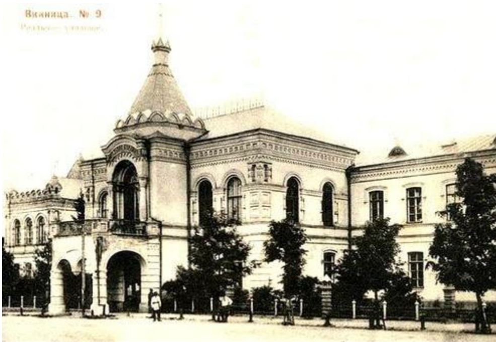
Рис. 6. Вінницьке реальне училище. Поч. XX ст.