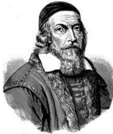
Ян Амос Коменський

Складовою частиною усебічного виховання підростаючих поколінь вважав фізичне виховання англійський юрист, філософ, письменник-гуманіст Томас Мор (1478–1535).