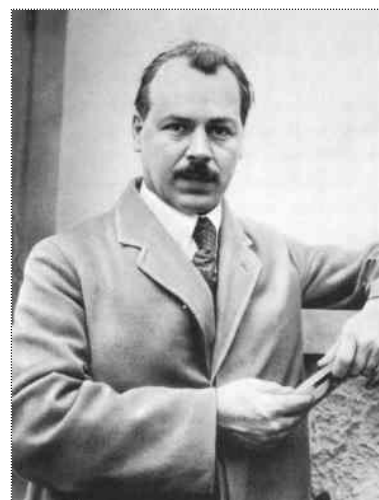
М. І. Вавилов

В розвитку аграрної науки у 30-х роках ХХ століття виокремлюється два періоди, які різнилися за принципами і підходами до становлення вітчизняної сільськогосподарської дослідної справи. Перша половина десятиліття пронизана ідеєю академічності на чолі з академіком М. І. Вавиловим, друга – розвитком дослідництва у колгоспній дослідній справі, ініціатором якої був Т. Д. Лисенко.