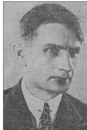
Т. Д. Лисенко

Однак певна недовіра з боку переважної більшості селян і особливо вчених не тільки до перспектив колгоспної дослідної справи, а й взагалі щодо її розгортання спонукала П. П. Постишева безпосередньо звернутися до визнаних у країні академіків-аграріїв [16, С. 122–123]. Усі, до кого звернувся Постишев, не лише його підтримали, а й через провідні друковані засоби висловилися за «світле майбутнє починання». Серед них, крім Т. Д. Лисенка, були В. Р. Вільямс [20], І. В. Мічурін [6, 7] і навіть М. І. Вавилов [4]. Їхні статті–звернення до селянства України друкував спеціально створений у 1935 році масовий науково-популярний колгоспний журнал Наркомзему УРСР «Хата–лабораторія».