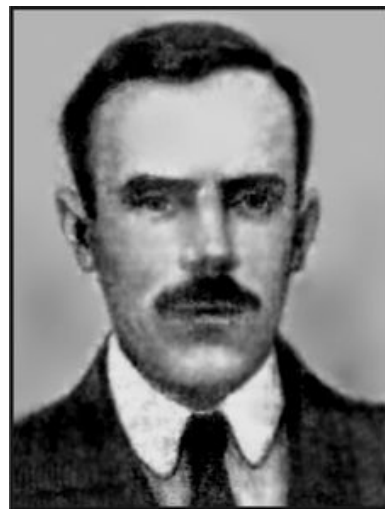
О. Яната (1888–1938)

Варто наголосити, що вчений секретар СГНКУ, професор О. Яната особисто багато уваги приділяв започаткуванню та становленню українських сільськогосподарських часописів у 20-х рр. минулого століття. У своїй статті «Сучасні завдання сільськогосподарського видавництва на Україні та його організація» вчений вказав на шляхи подолання хаотичного становища та подальшого розвитку видавничої справи. Він вірив, що всі негаразди є тимчасовим явищем: «І коли сьогодні сільськогосподарська наука на Україні перебуває ще в злиднях, то позавтра вона має вже розцвісти, бо повинно буйно розвиватися на Україні саме сільське господарство» [4]. О. Яната подав програму організації видання наукової галузевої літератури, вперше порушив питання «організованості, проведеної на принципах спеціалізації» галузі. Сьогодні ми можемо з впевненістю відмітити далекоглядність поглядів видатного науковця, який наголошував, що всі праці, які б дрібні вони не були, повинні збиратися в Україні у спеціальні центральні друковані органи кожної галузі сільськогосподарської науки, щоб жодна з них, де б вона не була зроблена, не загинула б для сільськогосподарського знання. У