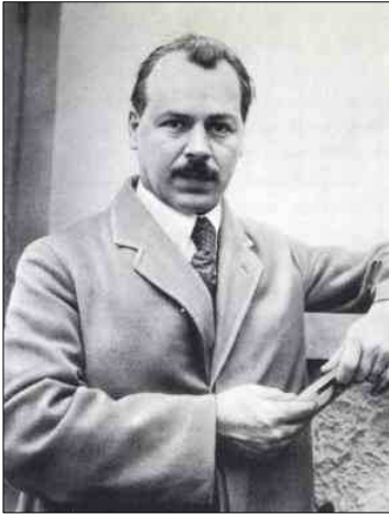
Вавилов М.І. (1887–1943)

визначних діячів з оточення відомих вчених-економістів О.В. Чаянова і М.Д. Кондратьєва, яких реабілітували лише в 1987 р. За цією справою з клопотаннями за арештованих виступав і відомий академік М.І. Вавилов. На жаль, у подальшому це послугувало приводом для звинувачень ученого в «... керівництві антирадянською шпигунською організацією «Трудова селянська партія» в 1941 р. [5].