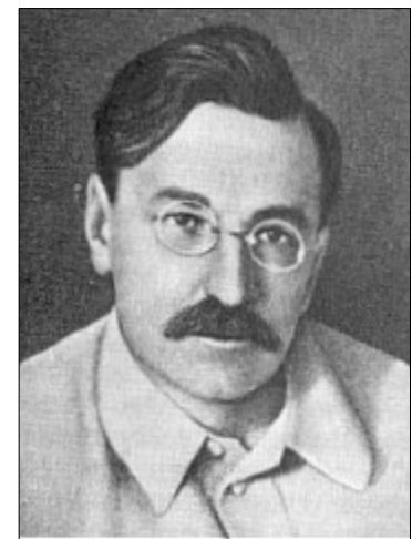
Менжинський В.Р. (1874–1934)