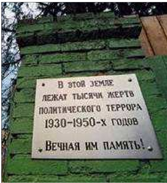
Плита пам'яті жертв політичних терорів 1930–1950 рр., встановлена на Ваганківському кладовищі (м. Москва)