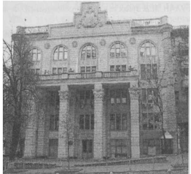
Рисунок 1. Будинок Президії УАСГН

Потреба в удосконаленні управління наукою й поліпшенні дослідної справи зумовила створення розгалуженої мережі науково-дослідних установ. Було покликано до життя багато нових дослідних інститутів, станцій і безпосередньо самого керівного центру при Міністерстві сільського господарства УРСР (рис. 1). Українська академія сільськогосподарських наук здійснювала