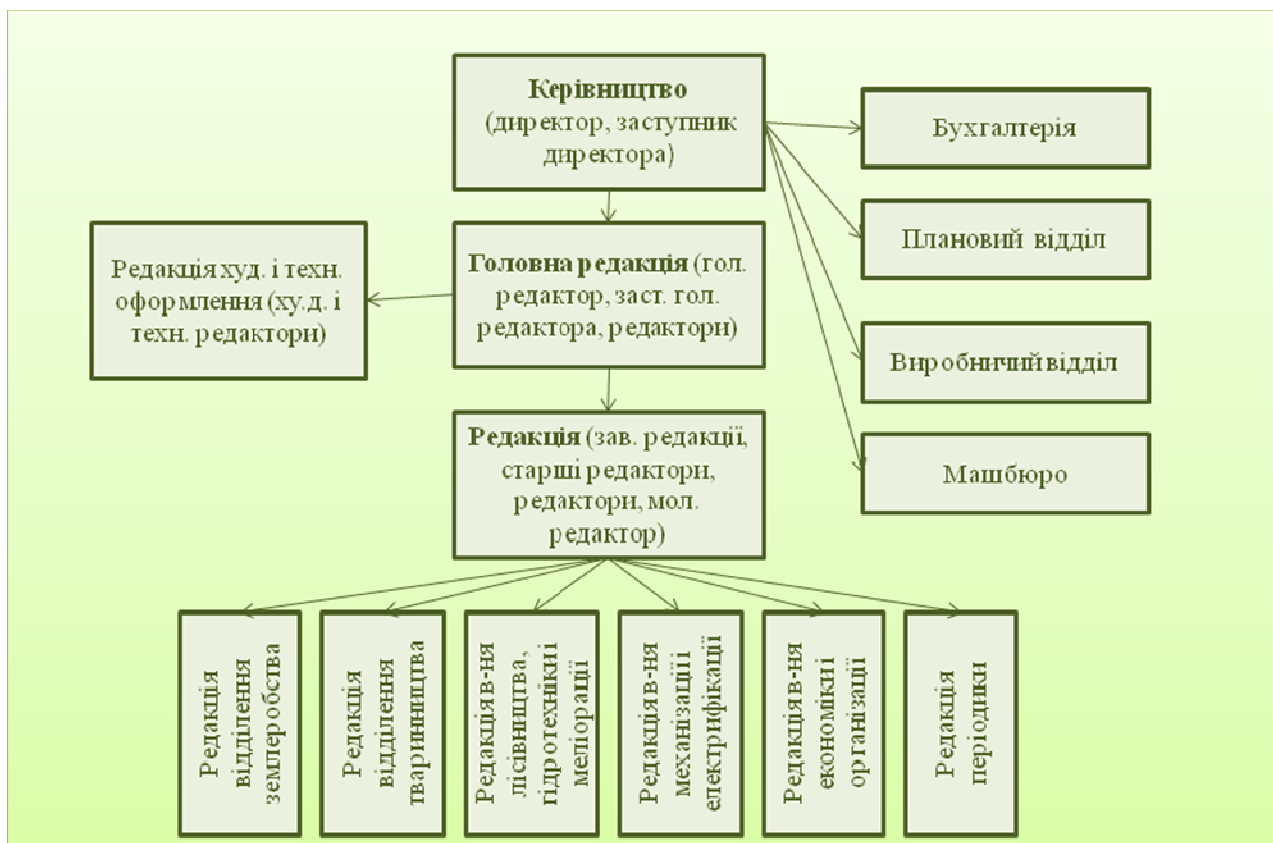
Рисунок 3. Структура Видавництва УАСГН, 1958 р.

Управлінський апарат Академії у виконанні своїх функцій мав конкретне визначення: 1. Координація науково-дослідної роботи й впроваджень у виробництво досягнень науки і досвіду передовиків сільського господарства. 2. Розширення і зміцнення мережі установ. 3. Науково-методичне керівництво обласними державними сільськогосподарськими дослідними станціями. 4. Підготовка наукових та науково-педагогічних кадрів. 5. Видавнича діяльність. 6. Міжнародне співробітництво.