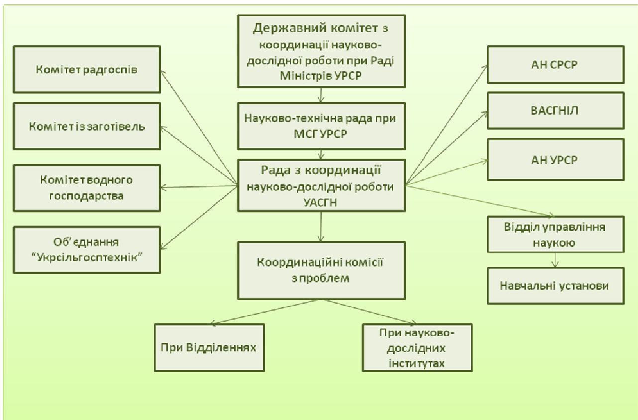
Рисунок 4. Схема координації УАСГН

Аналіз наукових звітів установ Академії свідчить про значну оптимізацію впровадження основних результатів науково-дослідних робіт у сільськогосподарське виробництво, особливо помітні зрушення відбулись у 1960-1961 рр. Принципово новим у цьому процесі став перехід від застосування окремих прогресивних прийомів наукових методів ведення землеробства і тваринництва до їх комплексного впровадження.