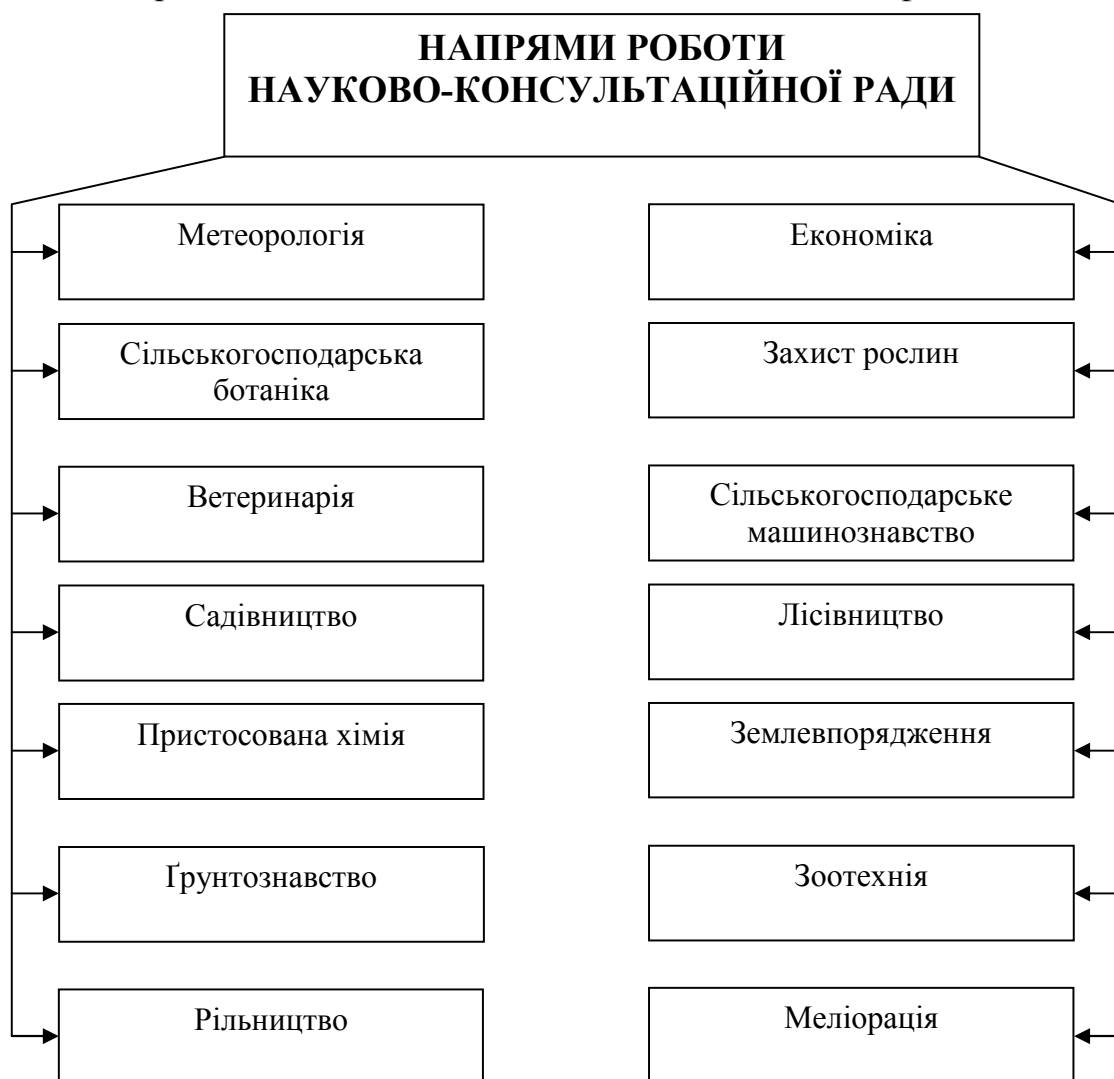
Рис. 1. Напрями роботи Науково-Консультаційної Ради при НКЗС у 1928 році

При Рецензійному Бюро працювали постійні відповідальні рецензенти – фахівці, затверджені Бюро НКРади. На засіданнях розглядалися матеріали за наявності фахової рецензії щодо них: наукової обґрунтованості, ідеологічного змісту, практичної придатності (з урахуванням районної спеціалізації УСРР), наочного приладдя, технічної, конструктивної та монтажної характеристики й установлених стандартів, форм і розмірів. У разі розходження думки членів Бюро матеріал передавали на повторну рецензію. За наявності окремої думки одного з членів Рецензійного Бюро це питання розглядали на Бюро НКРади.