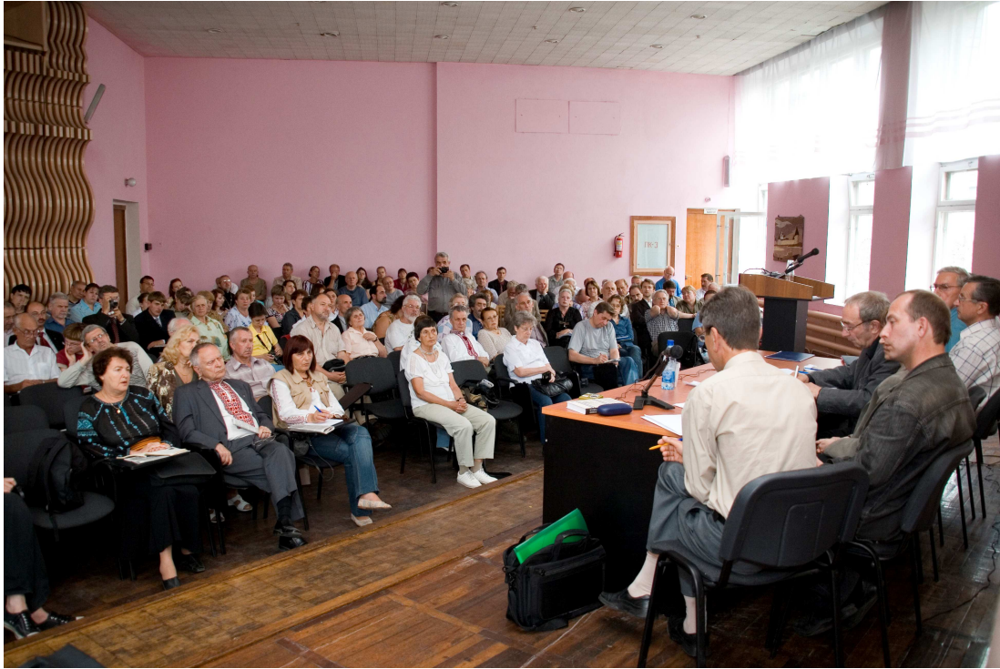
Українська делегація на конференції російського товариства "Меморіал", м. Медвежогорськ.

Незважаючи на сувору північну природу, здавна місцевий люд виношував судження про будівництво Онезько-Біломорського водяного сполучення, але далі розвідок справа не поспішала. Одвічна потреба розширення шляхів сполучення на неосяжних теренах країни, пов'язана з прісною державною казною нещодавно створеної радянської держави, змусила Раду Праці та Оборони СРСР 19 лютого 1930 р. вирішувати питання про реконструкцію та раціоналізацію морського і річкового транспорту. Записка до уряду, опрацьована на дореволюційних проектах Біломорсько-Балтійського водяного доступу, виявилася більш переконливою. Було затверджене таємне Положення про Особливий Комітет щодо його побудови з розширеними правами і загальним терміном будівництва в три роки. Спочатку будовою керував Наркомат шляхів сполучення. Та невилазна тайга, відсутність належного постачання, нестаток кадрів призвели до того, що підтримка будівництва все більше здійснювалася силами головополітуправління, а з листопада 1931 р. ОДПУ й керувало забудовою. От так і витворилася ця змичка, яка з часом пройнялася репресивним жахом. Допроводжувало "будкадри" Управління Соловецьких таборів особливого призначення (за рос. скороченням – УСЛОН),