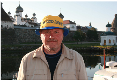
Автор на о. Соловки

In connection with the memory of the victims of political repressions, the competitor of the State scientist agriculture library UAAS for the first time shares with the impressions about Ukrainian delegation trip to the tract Sandarmokh in Karelia and to the Slovyetskyi archipelago in Russia under the direction of Ukrainian institute of national memory.