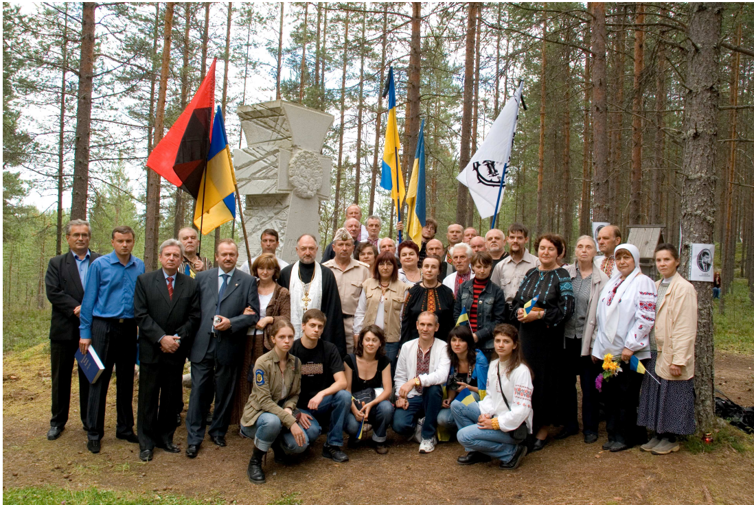
Українська делегація біля хреста "Убієнним синам України", урочище Сандармох.