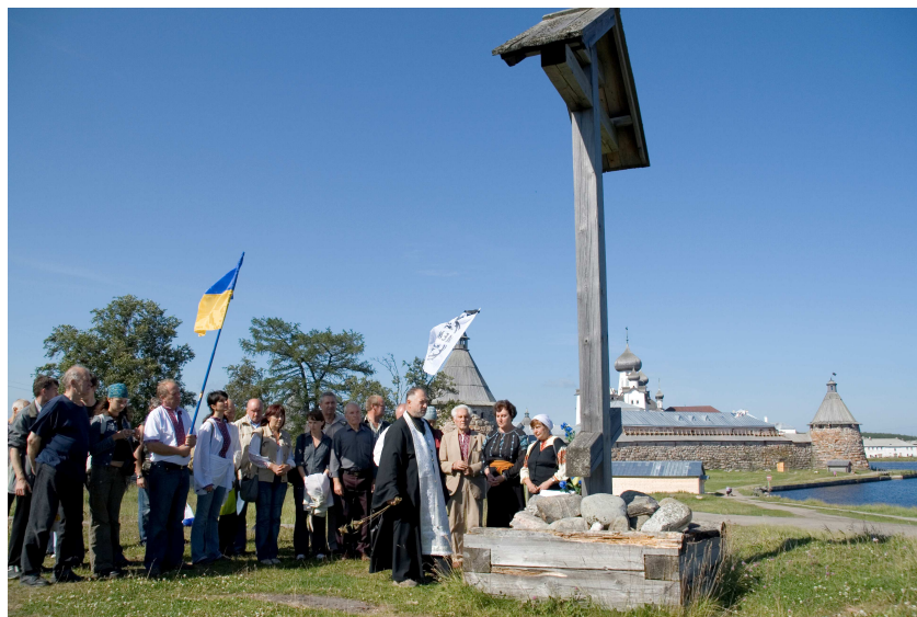
Молебень біля хреста, під яким, вважається, поховані репресовані українці, о. Соловки.