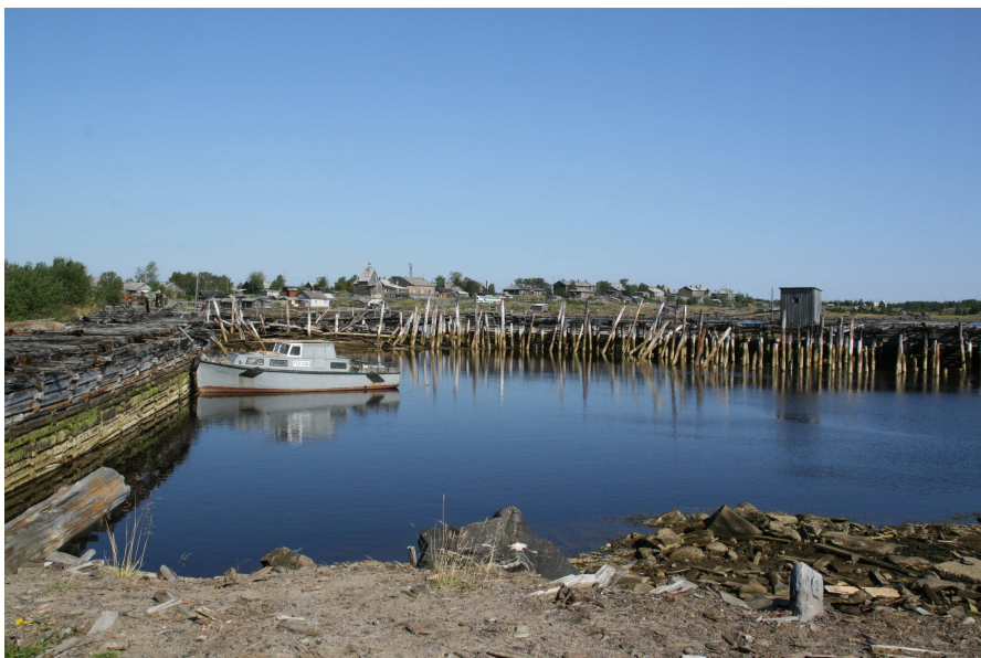
Портові руїни, що залишилися з часів репресій, порт Кем на березі Білого моря.

Наступного дня автобус вирушив до порту Кем, де делегацію чекав катер.