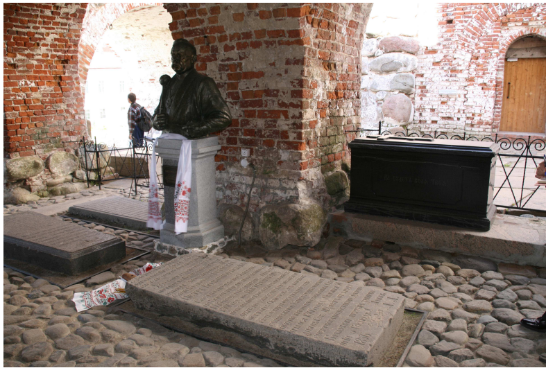
Пам'ятник гетьману Петру Калнишевському в Соловецькому кремлі.

Делегація брала участь у меморіальному масовому мітингу біля Соловецького каменя, який відбувся перед пам'ятником загиблим від репресій, виступали учасники української делегації. Відбувся молебень за участю місцевих священників. Okремо отець Володимир відбув молебень за участю членів української делегації біля Соловецького каменя.