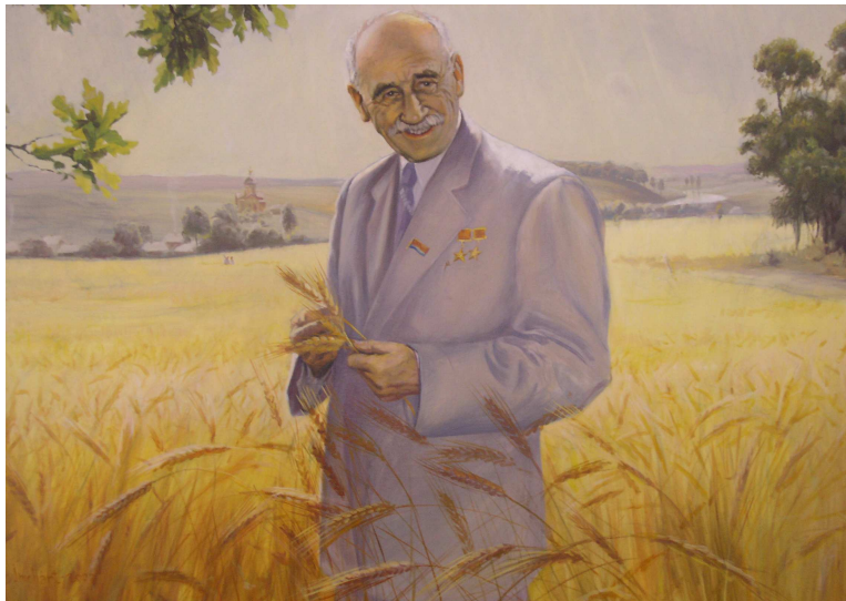
Фото 6. В.Я. Юр'єв на полі дослідного господарства «Елітне», 1958 р.

Усі, хто знав В.Я. Юр'єва і говорять про нього, не забувають нагадати про його скромність. Ця риса характеру відчувалася в усьому: і в манері одягатися, і в оцінці своєї праці. Йому, як двічі Герою Соціалістичної праці, повинні були встановити бронзовий бюст ще за життя на його батьківщині. Коли постало це питання, він звернувся до Президії Верховної Ради СРСР з проханням: «Прошу, як виняток, дозволити спорудження пам'ятника не на місті мого народження – в селі Вірга, а в місті Харкові, де я 50 років живу і працюю і вважаю Харків за свою другу рідну батьківщину». Біля сучасного кінотеатру, в мальовничому куточку Харкова, на вулиці «бульвар В.Я. Юр'єва», вже 47 років стоїть бронзовий бюст роботи скульптора В.І. Агібалова.