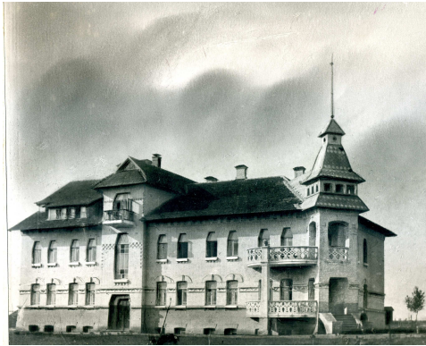
Фото 3. Харківська селекційна станція, 1908 р.

конки закінчувався біля заводу сільськогосподарських машин Гельфериха-Саде (згодом «Серп і молот»). Це невеличке підприємство було єдиним на той час на цій вулиці. Юр'єву довелося пішки пройти декілька кілометрів туди, де за Кирило-Мефодіївським цвинтарем міська дума відвела новій дослідній установі сто двадцять п'ять десятин землі (Фото 3).